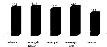
Grafik 1 : Status ekonomi responden

Karakteristik responden dari segi pendidikan tertinggi yang ditempuh, responden tidak tamat SLTA yaitu sebesar 27 persen. Persentase terbanyak terdapat pada kelompok usia 15-19 tahun sebesar 59 persen wanita tidak tamat SLTA. Dari karakteristik wilayah, terbanyak terdapat di wilayah perdesaan sebesar 27 persen. Sedangkan dari sisi kuintil kekayaan (status ekonomi), tertinggi pada kelompok ekonomi menengah bawah, seperti yang tergambar dari grafik berikut ini :